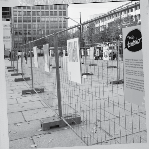
Première van het Straatsalon 2009, Kouter Gent