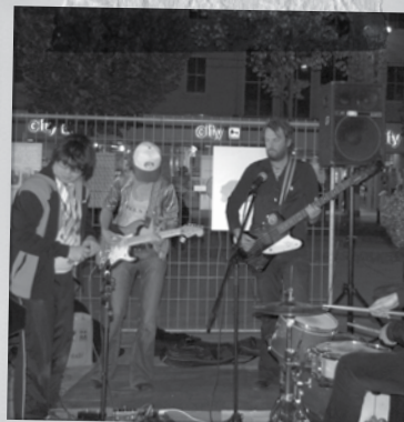
Optreden 'TRAM' tijdens de premiere van het Straatsalon, Kouter Gent 2009