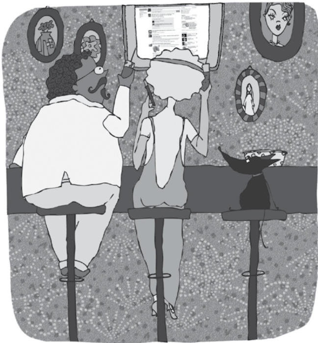
“Actief burgerschap is NIET enkel vrienden hebben op facebook, zodat je niemand hoeft te tracteren op café” Folder Sociumi 2009, Illustratie © Myriam Kalai

terwijl de Vlaamse overheid minderheden meer als culturele minderheden opvat. Over het algemeen is het echter niet een beleidsfilosofische kwestie over structuur en cultuur, maar wel het versnipperde karakter van de Brusselse bevoegdheden m.b.t. een intrinsiek sterk transversaal beleidsdomein als informatica dat de ontwikkeling van coherent beleid bemoeilijkt.