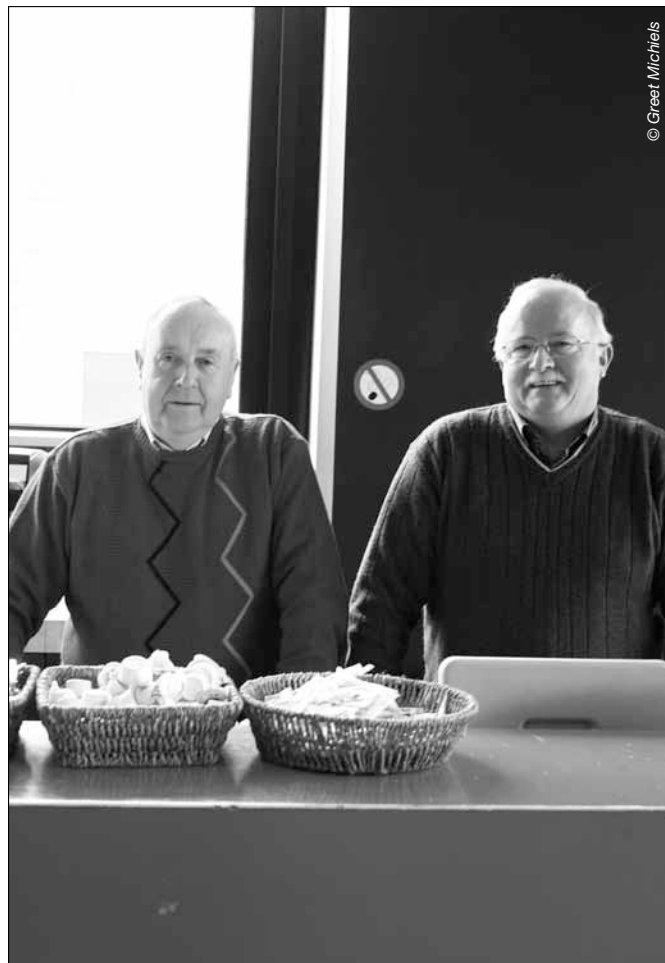
Vrijwilligers in beeld

Dinamo evalueert de activiteiten van de vrijwilligers met het oog op het krijgen van feedback en op het optimaliseren van de werking. Er zijn evaluatieformulieren: de deelnemers worden bevraagd over een bepaalde activiteit. En/of er is een gesprek tussen vrijwilliger en programmaverantwoordelijke of de programmaverantwoordelijke brengt een bezoek aan een cursus of workshop. Voor alle vrijwilligers is er in het voorjaar tijdens de planning van het volgende seizoen een evaluatiegesprek. Voor een beginnend vrijwilliger is er minstens 2 maal per jaar een gesprek. Opmerkelijk is dat een beginnende vrijwilliger bij Dinamo maximaal 2 verschillende activiteiten mag uitoefenen.